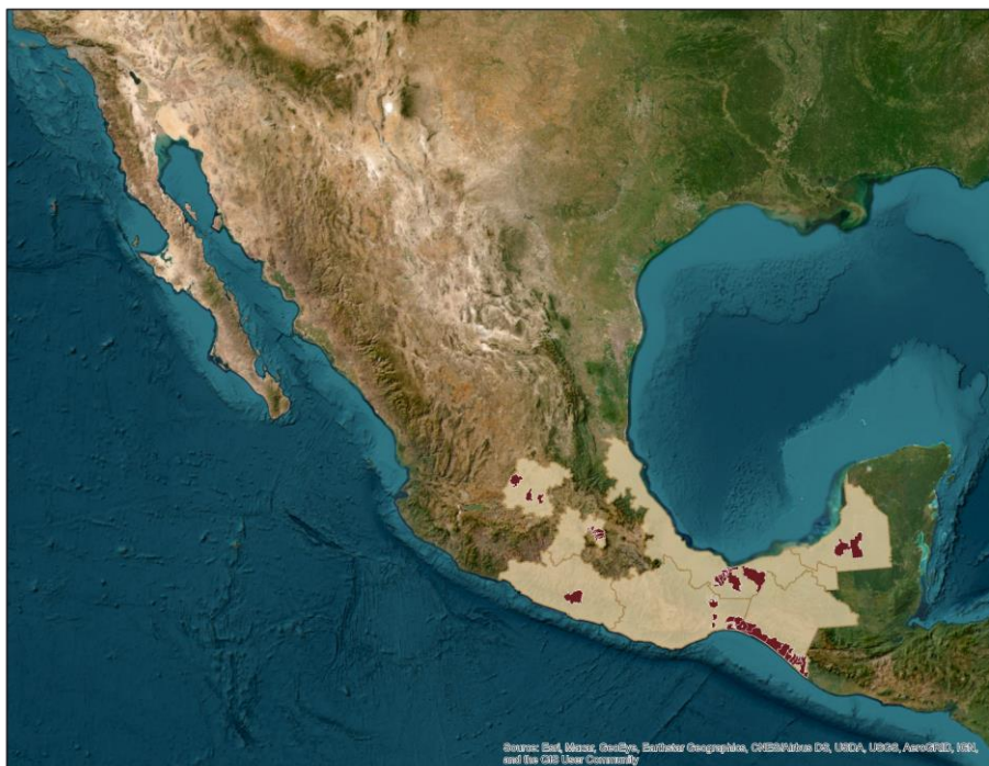
Gráfico 2 Proyectos a Intervenir por Entidad Federativa de la Vertiente Obras Comunitarias que contaron con la revisión técnica, normativa y presupuestal.