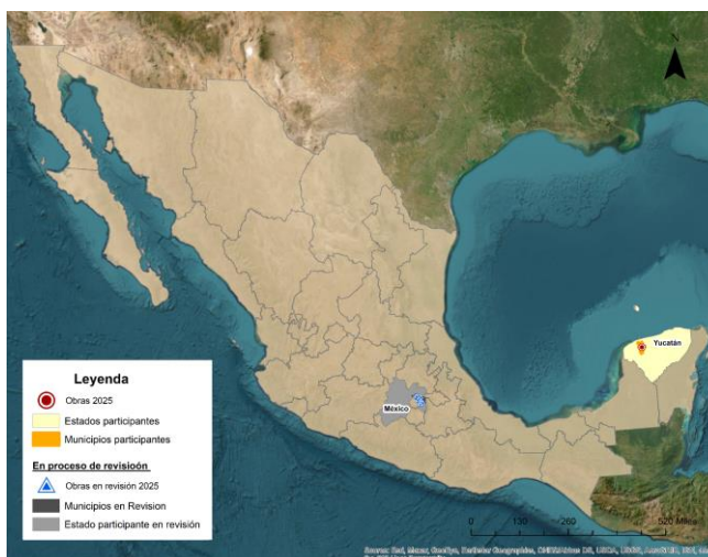
Gráfico 3 Beneficiarios por Entidad Federativa de la Vertiente Infraestructura y Equipamiento