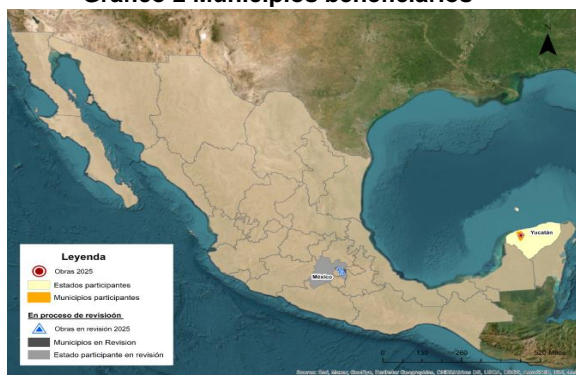
Gráfico 2 Municipios beneficiarios