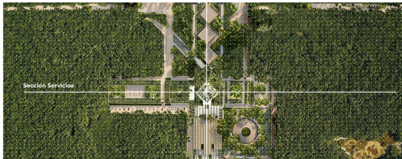
Planta de conjunto