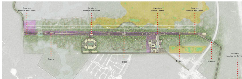
Planta de conjunto