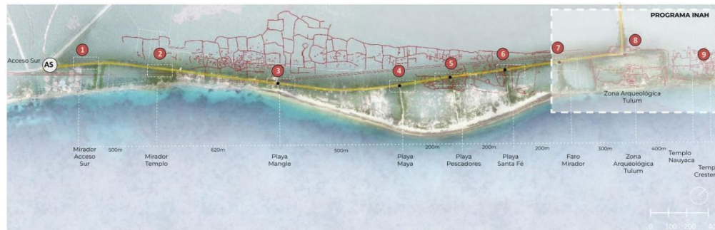
Planta de conjunto