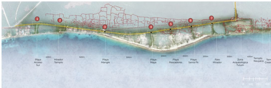
Planta de conjunto

Av. Coba y La Costera S/N, 77780 Tulum, Q.R..