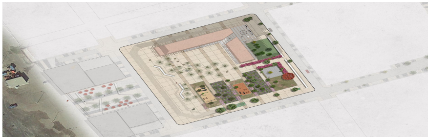
Planta de conjunto