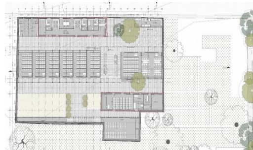
Planta de conjunto