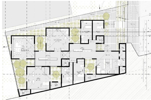
Planta de conjunto