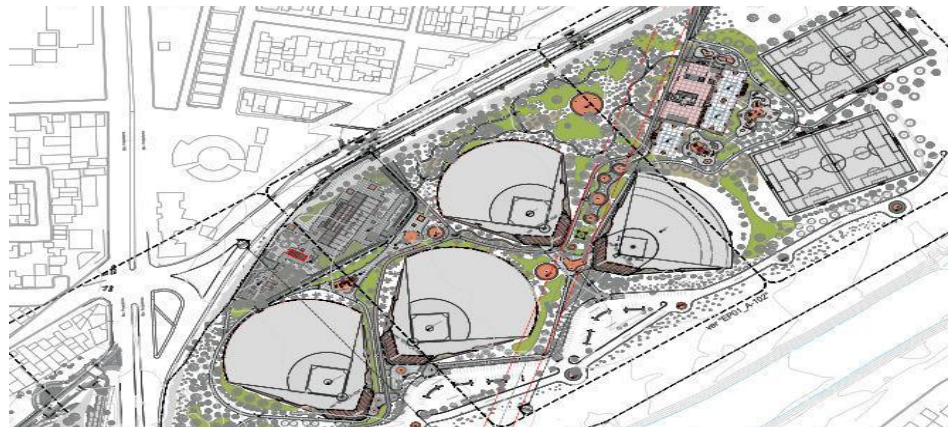
Planta de conjunto