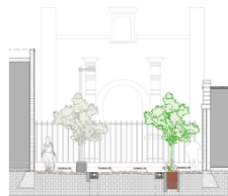
Corte calle de los Remedios