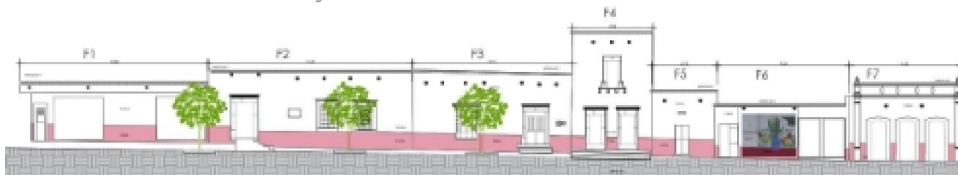
Fachada calle Morelos