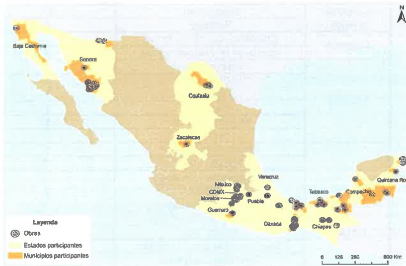
Mapa 2 Beneficiarios por Entidad Federativa