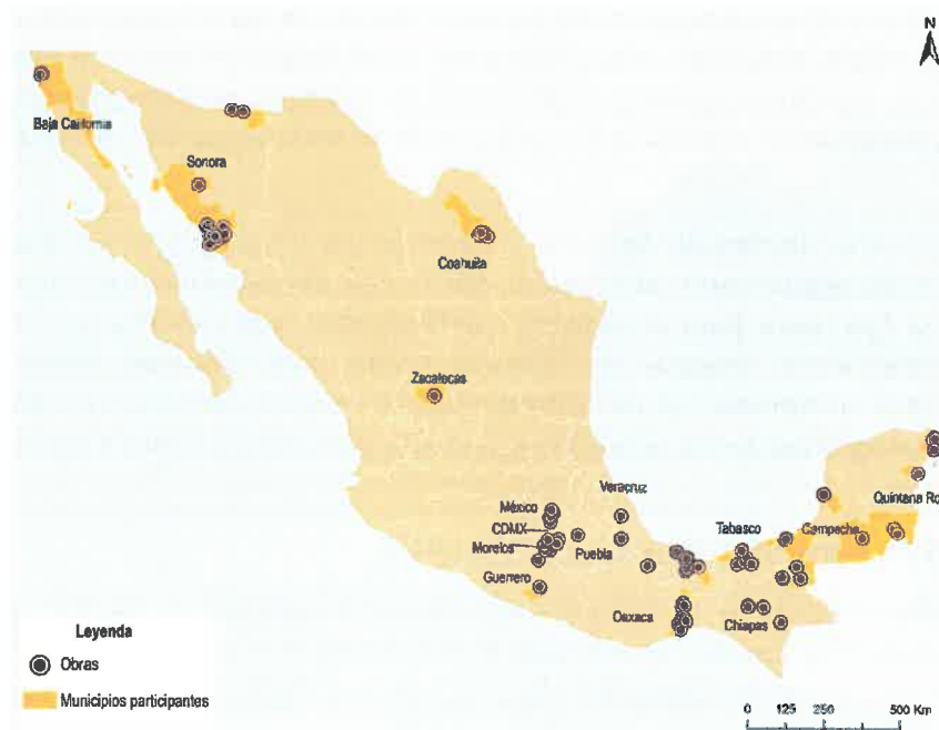
Mapa 1 Municipios beneficiarios