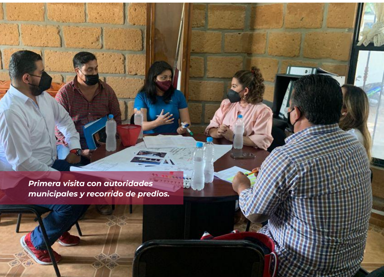
Primera visita con autoridades municipales y recorrido de predios.

Las propuestas de esta modalidad podrán ser presentadas por la Instancia Solicitante, la Instancia Auxiliar o la Instancia Ejecutora, atendiendo las siguientes disposiciones: