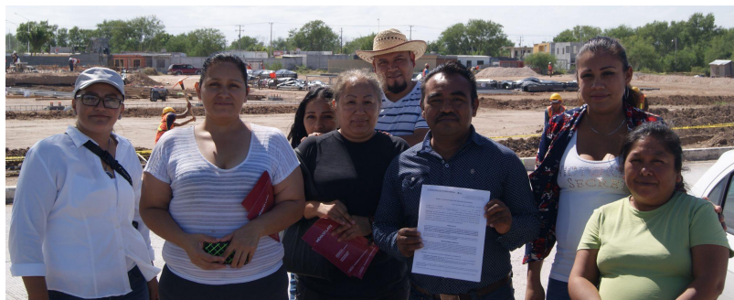
Conformación de Comité Comunitario.