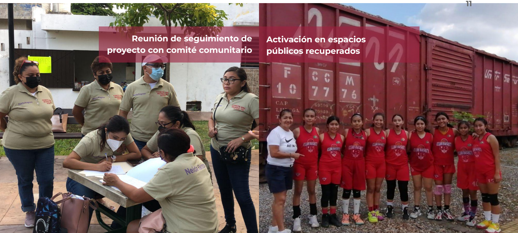
Reunión de seguimiento de proyecto con comité comunitario