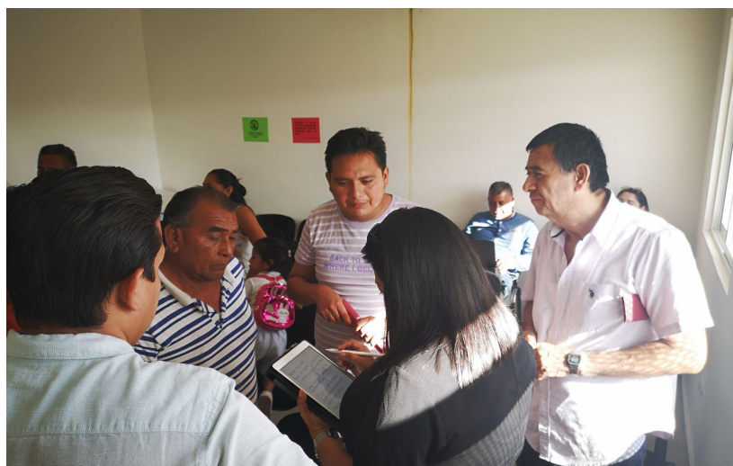
Retroalimentación con Comités Comunitarios.