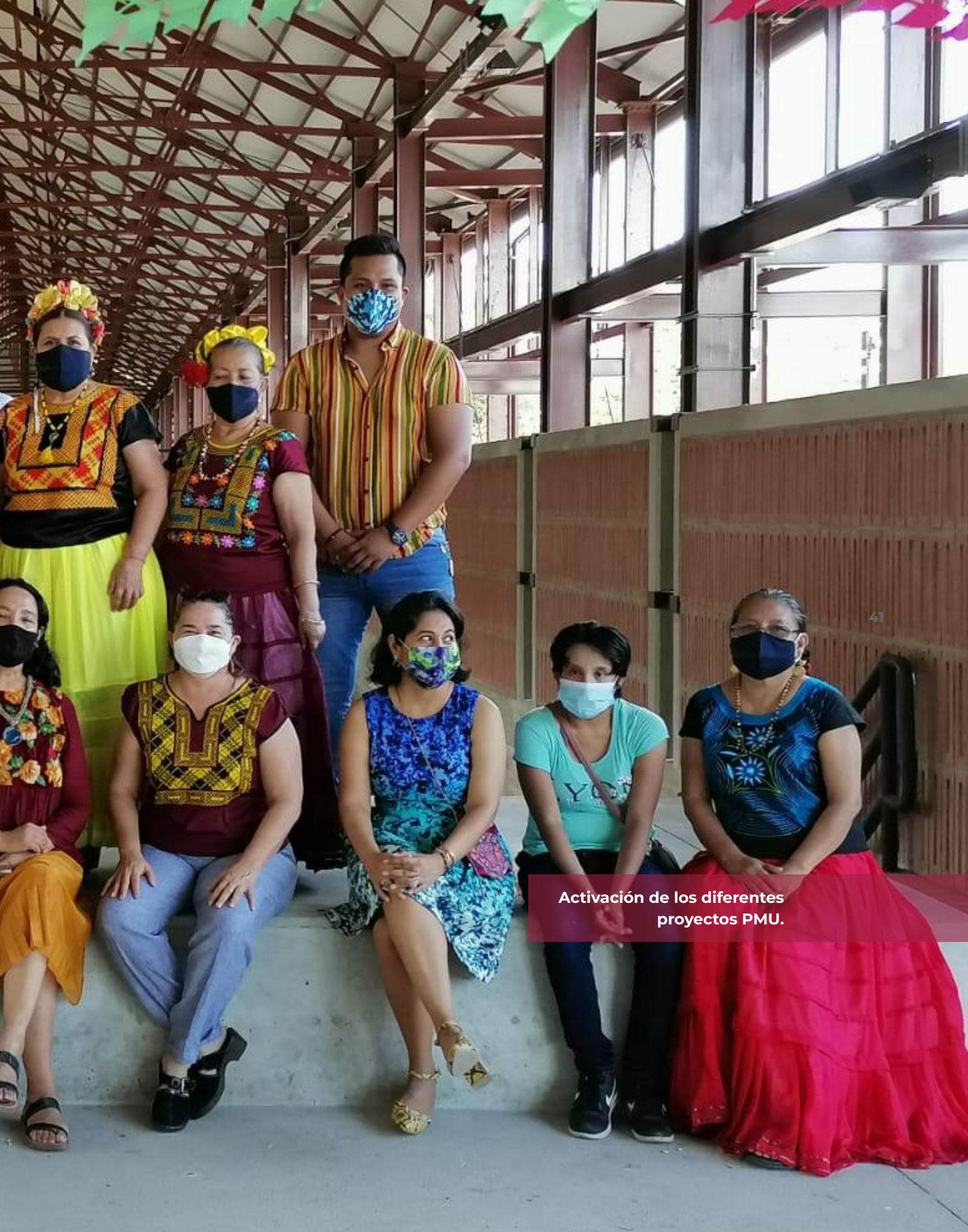
Activación de los diferentes proyectos PMU.