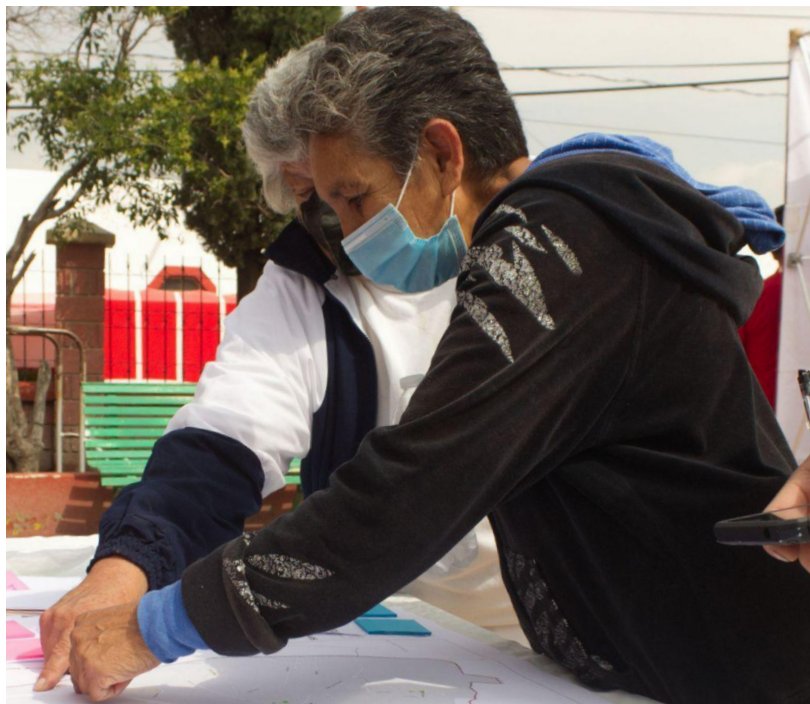
Localización de puntos importantes y potenciales en comunidad.