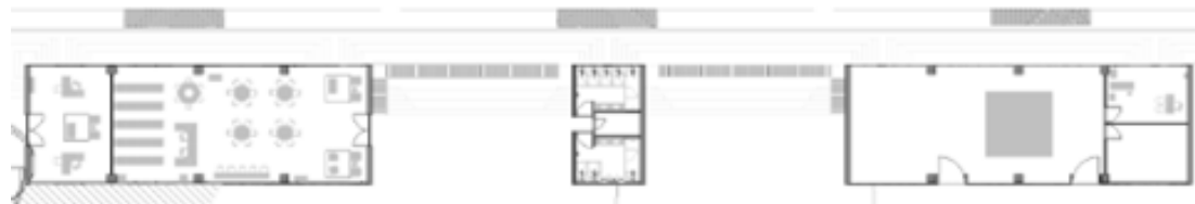
Planta edificio de Desarrollo Comunitario