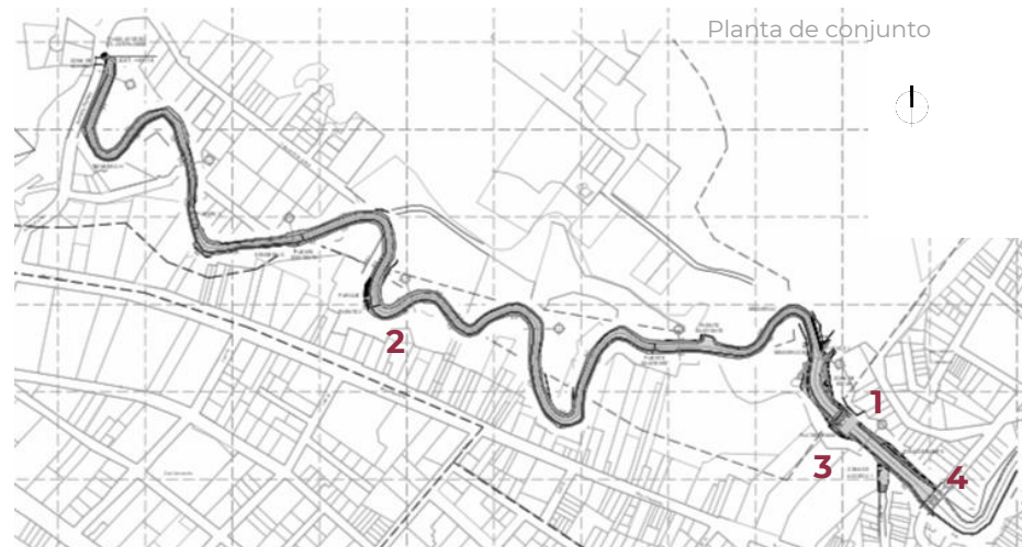
Planta de conjunto

Inicio en Ave. De las palmas y termino en calle 12.