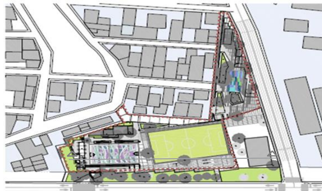
Planta de conjunto