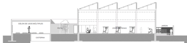
Corte longitudinal Gimnasio