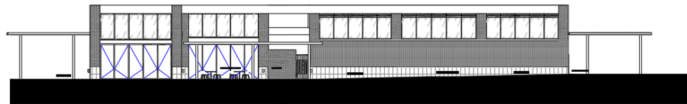
Corte Arquitectónica Norte