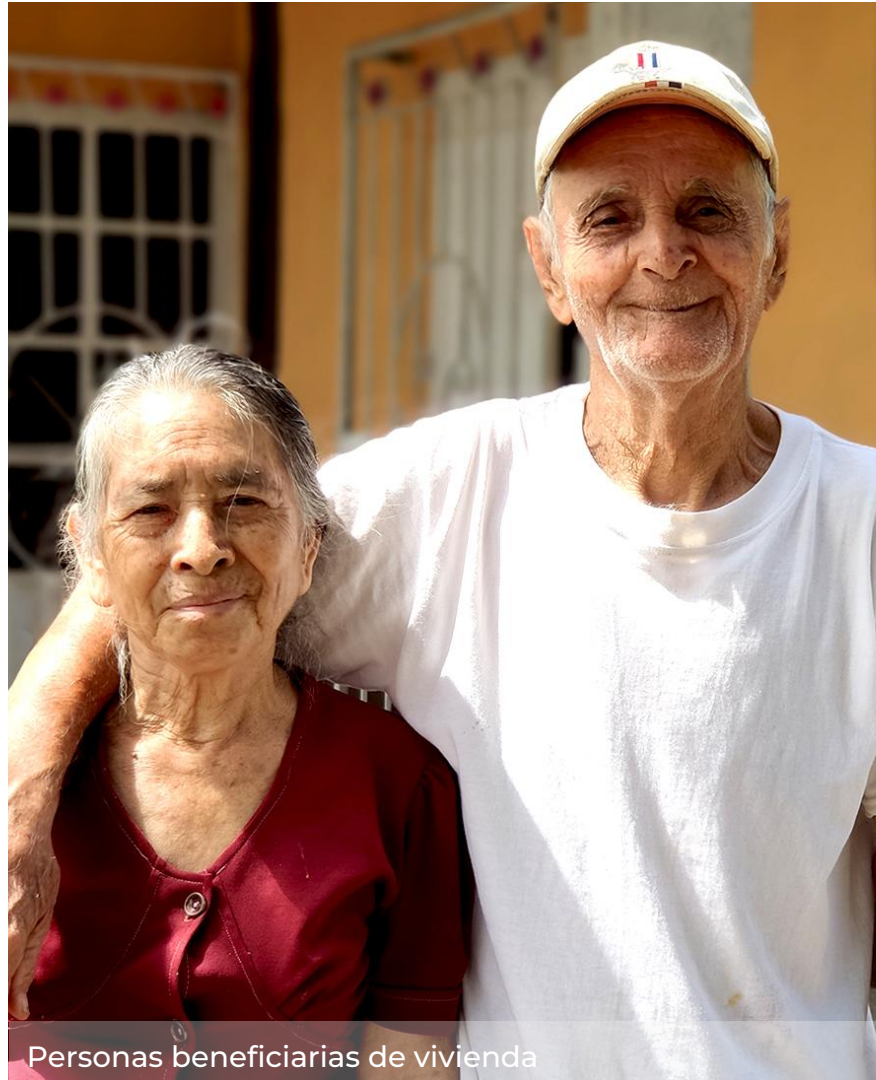
Personas beneficiarias de vivienda