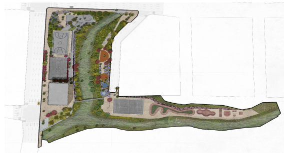
Planta de conjunto

Av. Manuel Pérez Yáñez y Cañón Blanco, col. Ampliación Lucio Blanco