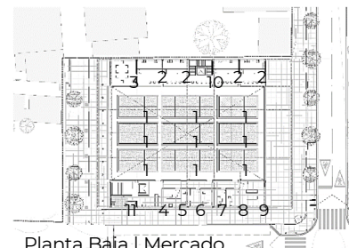
Planta Baja | Mercado