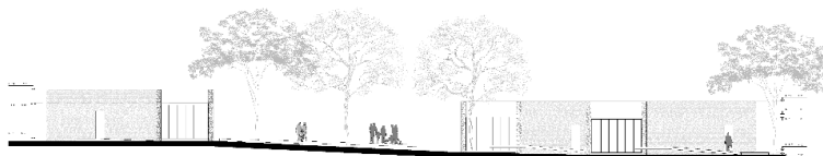
Fachada Atención Comunitaria y Biciestacionamientos